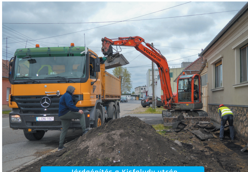
Járdaépítés a Kisfaludy utcán

Az előterjesztésben foglaltak szerint mind a Városgondnokság, mind a Pápai Városgondnoki Társaság Kft. tevékenységi körében szerepelt korábban a közterületek építése és megújítása – járdaépítés és fel-