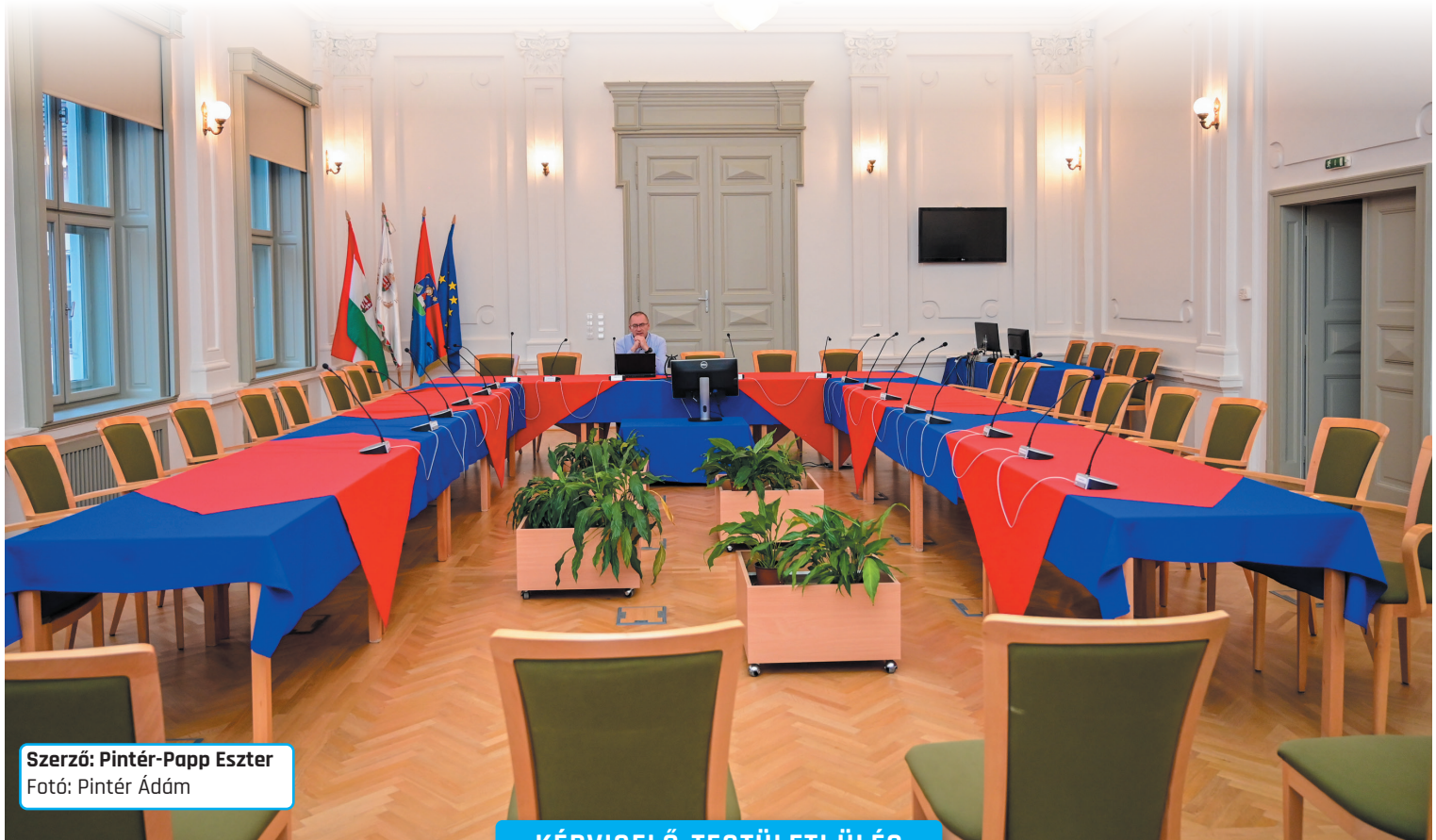
Szerző: Pintér-Papp Eszter