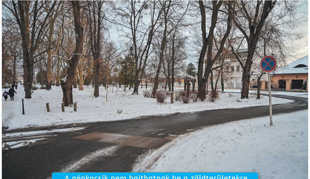
A gépkocsik nem hajthatnak be a zöldterületekre

” A közösségi együttélés alapvető szabályait sértő magatartás a közterület-használatról szóló önkormányzati rendeletben meghatározott korlátozások megsértésével folytatott utcai zenélés