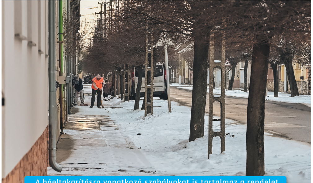
A hóeltakarításra vonatkozó szabályokat is tartalmaz a rendelet

Az üzletek működési rendjével kapcsolatos szabályozás értelmében a közösségi együttélés alapvető szabályait sértő magatartást követ el, aki kizárólagos, illetve többségi önkormányzati tulajdonú épület nem lakáscélú helyiségében – a melegkonyhás egység és a cukrászda kivételével – kimért szeszestalt forgalmazó üzletet üzemeltet, aki kizárólagos önkormányzati tulajdonú